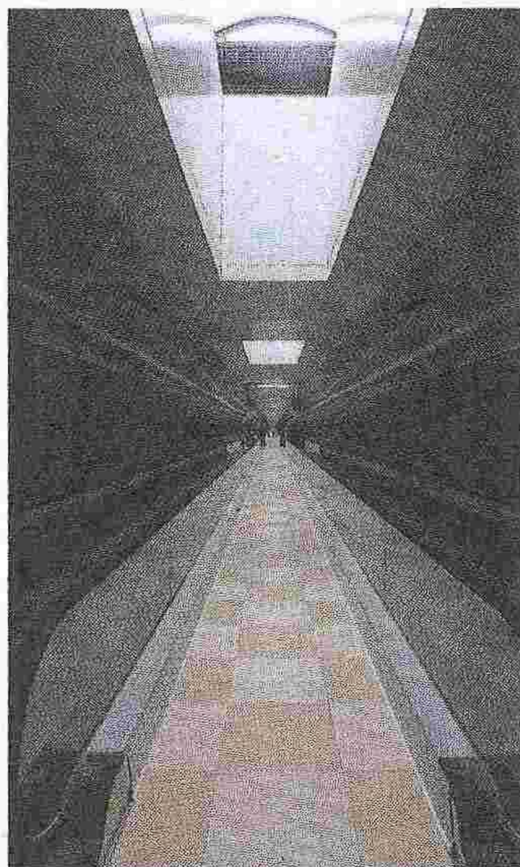
Passante pedonale Tapis roulant verso la stazione

Erano circa le 12,30, ieri, quando gli ultimi colpi dell'escavatrice hanno fatto cadere virtualmente il diaframma